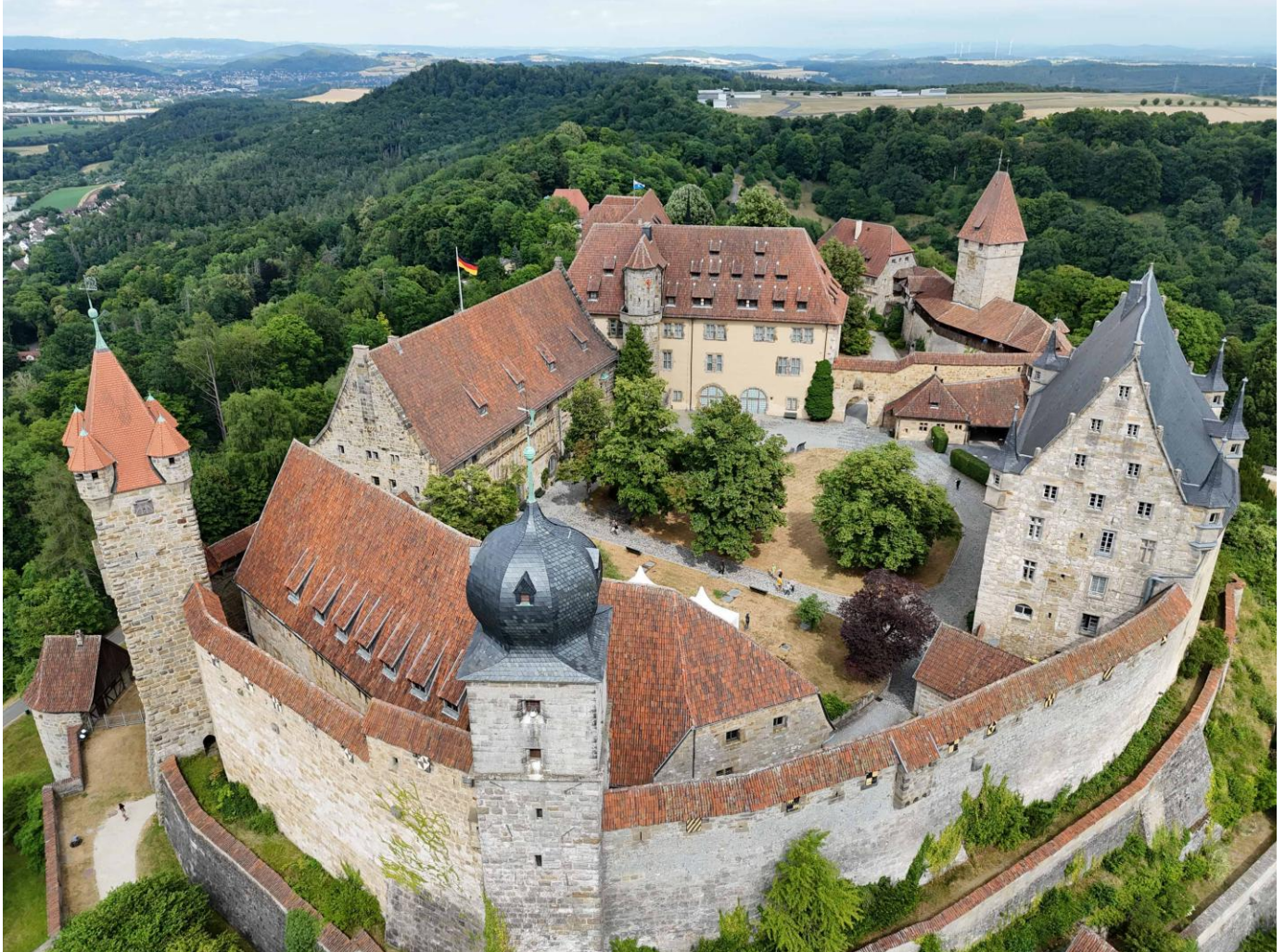
Veste Coburg von Westen, vorne der Blaue Turm (14. Jh.), hinten die Trennmauer zwischen Westhof und Osthof (Foto: G.U. Großmann, 2025)