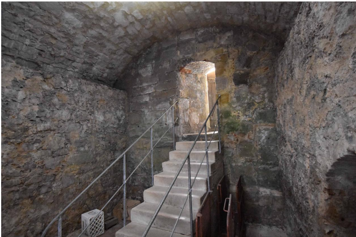
Veste Coburg, Kellerraum neben dem Bergfriedstumpf mit ältester Ringmauer und Ansatz des Torbogens (rechts in der Rückmauer)

Anmeldung zur Teilnahme per email an GvBueren@juelich.de oder g.u.grossmann@gnm.de