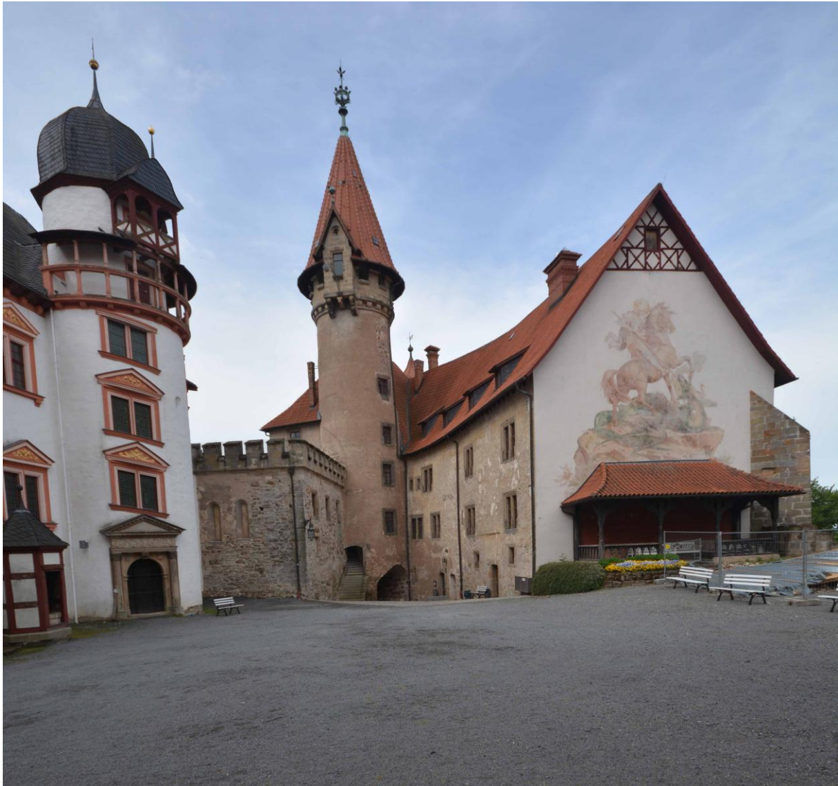
Veste Heldburg mit dem Georgsbild am Giebel des Kommandantenbaus

Am 8. September 2016 wurde nach mehrjähriger Vorbereitung das Deutsche Burgenmuseum auf der Veste Heldburg eröffnet. Das zehnjährige Jubiläum dieses Ereignisses wird das Museum mit einem Festakt im Beisein des Thüringischen Ministerpräsidenten am 8. September 2026 begehen. Die Wartburg-Gesellschaft ist dazu herzlich eingeladen.