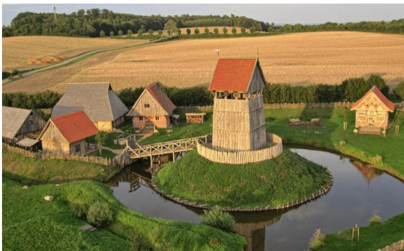
Rekonstruktion einer Turmhügelburg in Lütjenburg

Bewerbungen zu Tagungsreferaten erfolgen mit einem maximal halbseitigen Exposé bis zum 1.9.2026 an den Vorsitzenden der WBG per E-Mail ( gvbueren@juelich.de ). Es ist vorgesehen, die Tagung in einem Band der Reihe „Forschungen zu Burgen und Schlössern“ (Michael Imhof Verlag) zu dokumentieren. Referentinnen und Referenten sind vom Tagungsbeitrag befreit. Ob darüber hinaus Kosten übernommen werden können, hängt von der vorgesehenen, weiteren Drittmittelakquise ab.