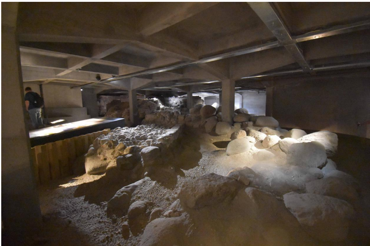
Eingangsbereich der Dauerausstellung (UG 2026)

Die Christiansborg in Kopenhagen ist in ihrer heutigen Erscheinung ein neobarocker Bau aus dem 1. Viertel des 20. Jahrhunderts. Gleich neben dem mittleren Durchgang befindet sich im Souterrain der Zugang zu den Grabungen, die teilweise unter dem Hof, teilweise unter dem Seitenflügel liegen. Betritt man den großen Raum, steht man vor den Resten zweier Ringmauern, einer aus dem 12. und einer aus dem 15. Jahrhundert, allerdings zunächst ohne eine klare Information, auf welcher Seite der Ringmauer man sich befindet. Schick designte Lageskizzen in schräger Draufsicht sagen zwar grob, wo man sich befindet, doch fehlt jede Orientierung zum gesamten Bau einschließlich dem heutigen Schloss und dem Zugang aus diesem in den archäologischen Keller.